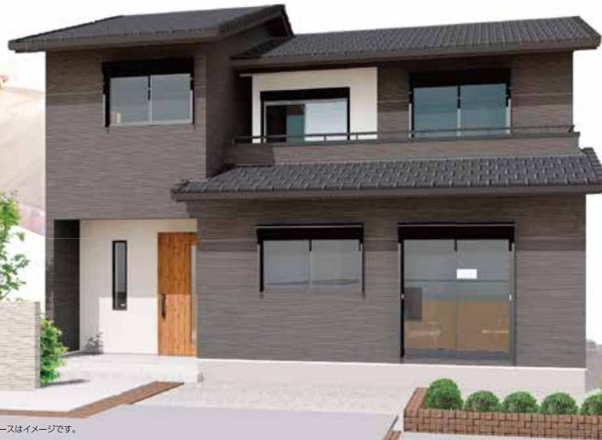
※パースはイメージです。