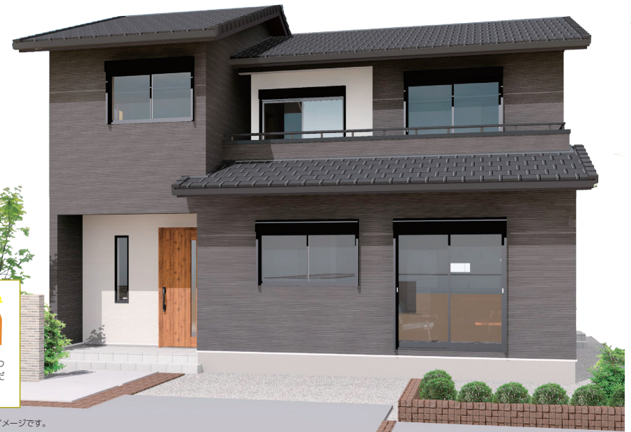
※パースはイメージです。

モデルハウスの“ウチトコ”とは、文字通り、ウチ(家)とコ(子)。 子どもと暮らす子育て世代に向けて、 子育てに適した住まいづくりのご提案です。